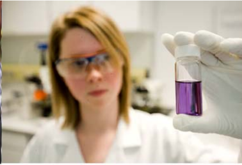
Merck KGaA Darmstadt

Organische Halbleiter, CIGS-Precursor, Formulierung von Druckpasten, Druckprozessevaluierung