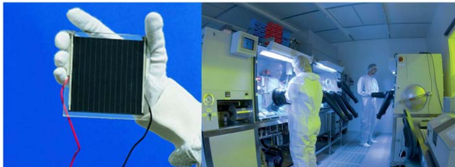
Zentrum für Sonnenenergie und Wasserstoff-Forschung Stuttgart

Entwicklung eines Lasersystems zum Ausheizen und Sintern von CIGS-Schichten