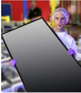
Würth Solar und Würth Electronics Research GmbH Schwäbisch-Hall