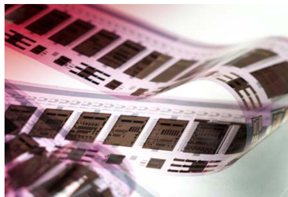
Gedruckte organische Schaltungen von der Rolle für RFID Anwendungen

Der Spitzencluster bündelt das Know-How von global agierenden Unternehmen - darunter viele Weltmarktführer - zwei Eliteuniversitäten und zahlreichen weiteren Partnern aus der Metropolregion Rhein-Neckar, um Deutschland an die Weltspitze bei der Entwicklung der Zukunftstechnologie Organische Elektronik zu führen.