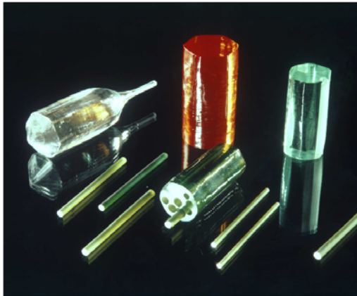
Links: Unterschiedlich dotierte Laserkristalle.

Gegen Ende dieses Projekts kann eine detailliert ausgearbeitete Modellvorstellung über die parasitären Absorptionen in Lasermaterialien vorliegen, zusammen mit einem neuen Herstellungsprozess für Materialien mit verminderten Verlusten.