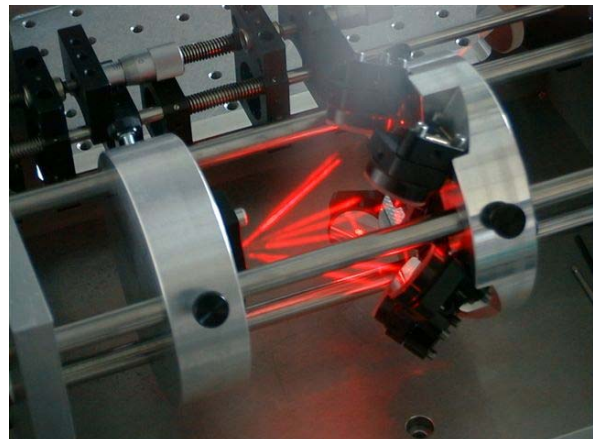
Detail eines Resonators

In diesem Wissenschaftlichen Vorprojekt sollen Laserkeramiken erforscht und adaptive Scheibenlaser-Resonatoren realisiert werden, die genau diese Keramiken als Lasermedium nutzen. Der Herstellungsprozess der Keramiken wird untersucht mit dem Ziel, möglichst homogene, defektfreie und damit hoch-transparente Keramiken zu realisieren. Die Keramiken werden in dem ebenfalls im Projekt untersuchten adaptiven Scheibenlaser-Resonator getestet und entsprechend den Ergebnissen weiter verbessert. Am Ende soll ein Laser stehen, der die innovative Laserkeramik verbindet mit einem neuen, adaptiven Resonator.